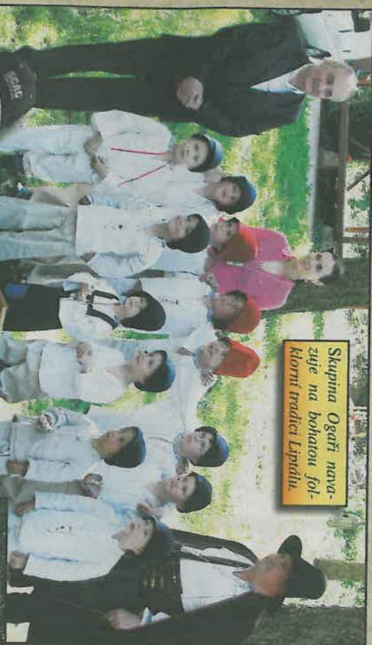
Skupina Ogarů navazuje na bohatou folklorní tradici Lipíálu.