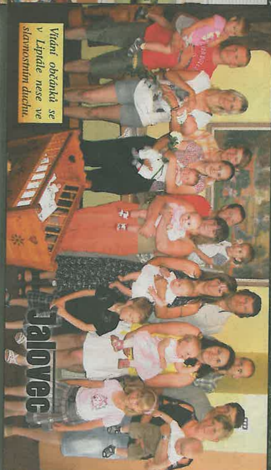
Vítání občánků se v Lipíále nese ve slavnostním duchu.