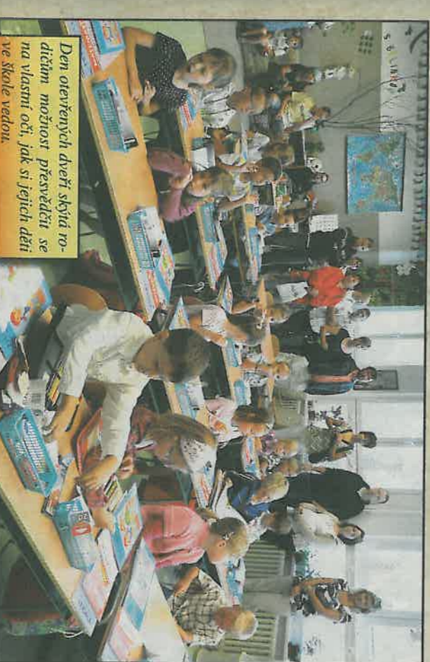
Den otevřených dveří skýtá roditelům možnost přesvědčit se na vlastní oči, jak si jejich děti ve škole vedou.