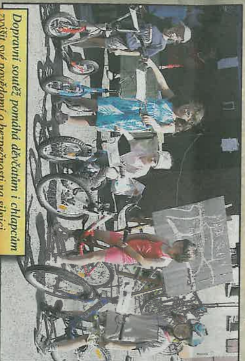
Dopravní souěž pomáhá děvčátkům i chlapcům zvyšit své povědomí o bezpečnosti na silnici.