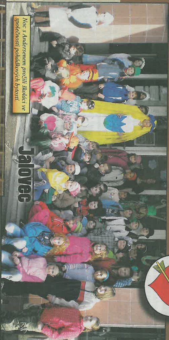
Noc s Andersenem prožili školáci ve společnosti pohádkových bytostí.