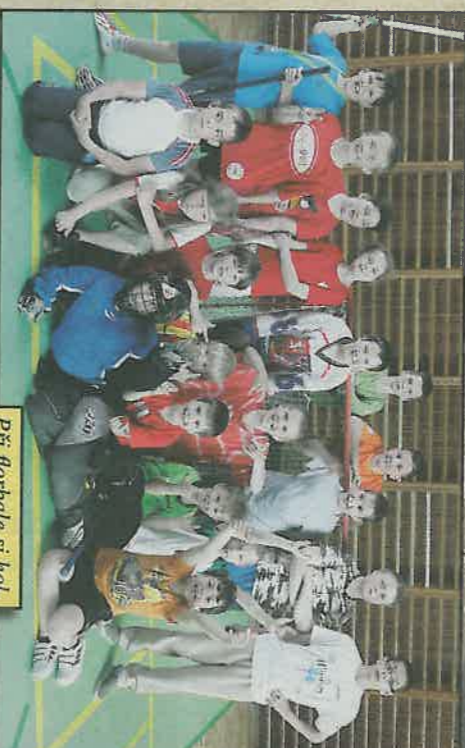
Při florbale si holky a kluci pořádně protáhli těla.