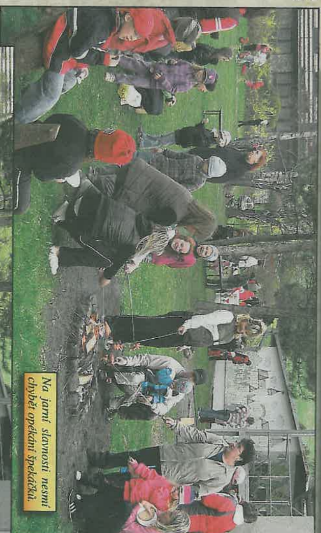
Na jarní slavnosti nesmí chybět opékání špekáčka.