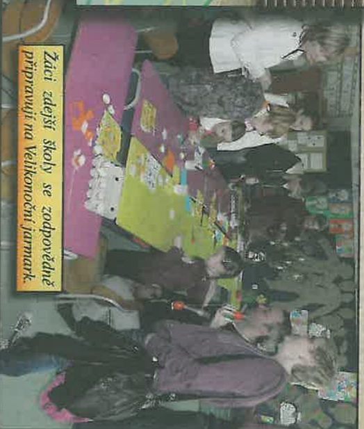
Záti záješí školy se zodpovědně připravují na Velikonoční jarmark.