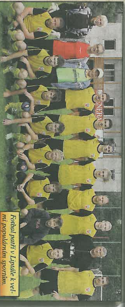
Fotbal patří v Lipítale k velmi populárním sportům.