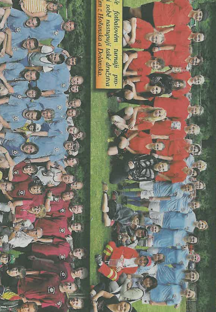
Ve fotbalovém turnaji pro- ti sobě nastupují také družstva žen z Hořanska a Dolanska.