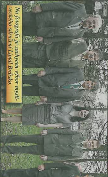
Na fotografii je zachycen výbor myslivčeského sdružení Lipíťáků Bratřsko.