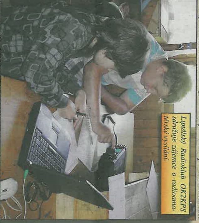
Lipíťáci Radia klub OK2KPS sdružuje zájemce o radioamatérské vysílání.

S naškolením se sportu věnují také zdejší volejbalisté a florbalisté. Zpevnit své tělo mohou zajímatci v hodinách zumbly nebo také fitness jógy. Ani děti nepřijdou zkrátka. Holky a kluci od prvního páté třídy mají možnost navštěvovat tančení a pohybovou přípravu k moderním tancům, jako je hip hop nebo street dance. Celá rodina se může společně protáhnout ve cvičení rodičů s dětmi. Příznivci bojových umění trenují dvakrát týdně karate pod vedením Radka Klehbla, jehož svěřenci získali 12 mistrovských titulů.