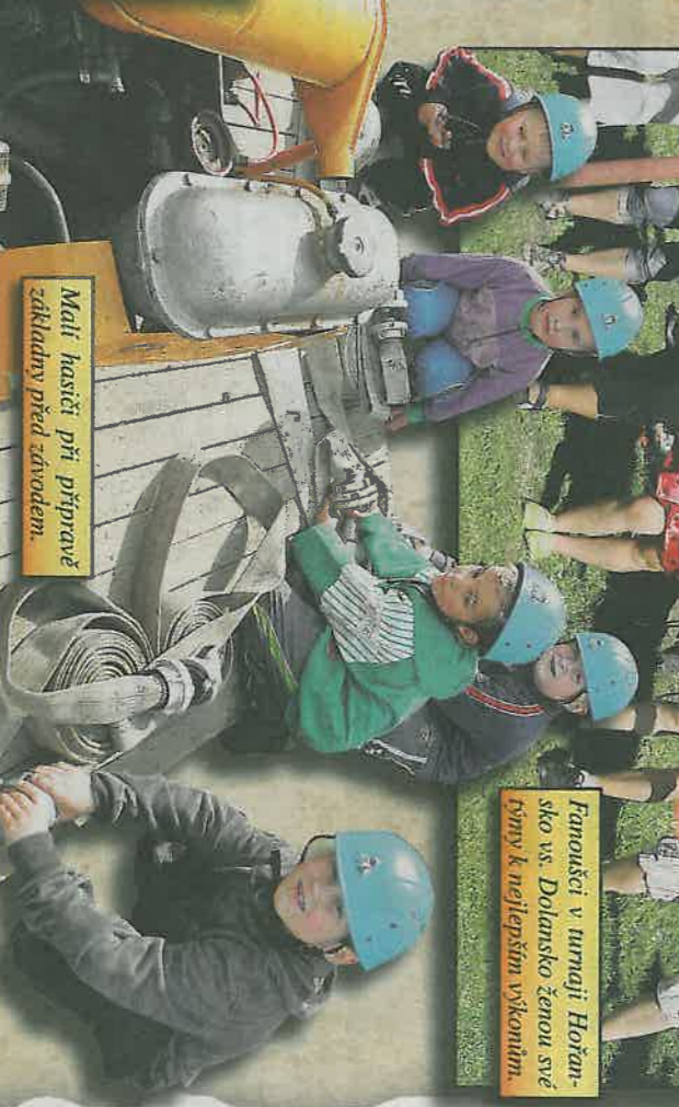
Malí hasiči při přípravě záklahy před závodem.