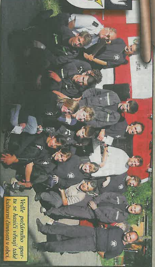
Vedle počítařilho sportu se hasiči věnují také kulturní činnosti v obci.