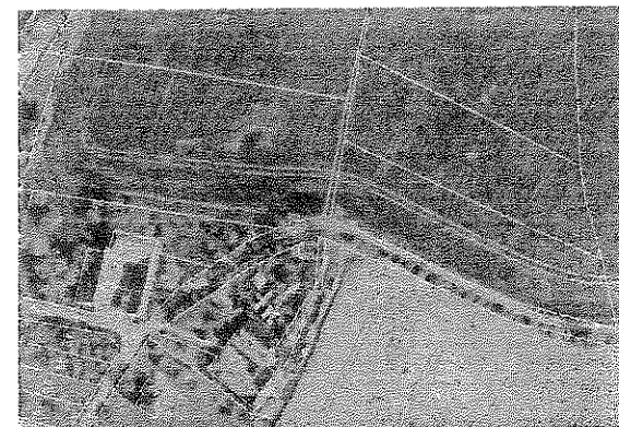
Ortofoto s obrazem katastrální mapy po obnově katastrálního operátu

Po skončení prací na obnově katastrálního operátu dochází k vyhlášení jeho platnosti. Podle § 62 odst. 2 katastrální vyhlášky (č. 26/2007 Sb.), zašle katastrální úřad sdělení o vyhlášení platnosti obnoveného katastrálního operátu obci, na jejímž území byl katastrální operát obnoven. Vyhlášení platnosti zveřejní katastrální úřad v součinnosti s obcí podle § 62 odst. 3 katastrální vyhlášky. Katastrální úřad a Český úřad zeměměřický a katastrální zveřejní vyhlášení platnosti obnoveného katastrálního operátu rovněž na svých internetových stránkách.