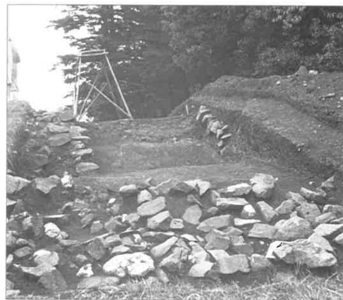
Požaha – řez hradbou (archeologický výzkum z roku 1962)

Styčnou plochou byla pravděpodobně oblast Hostýnských vrchů, protože v jejich západní části leží keltské oppidum 1 Hostýn a ve východní malé, ale opevněné púchovské hradiště na kopci Hradiště (u obce Loučka). Pohoří na východ 2 patřila již púchovskému lidu, jehož nejvýznamnějším hradištěm byla Požaha u Starého Jičina. Důležitým a dobře opevněným hradištěm je také dnes bezejmenná poloha jižně od obce Jasenice. Drobné osídlení existovalo rovněž v Pulčinských skalách. Několik jednotlivých nálezů pochází i ze Zubří.