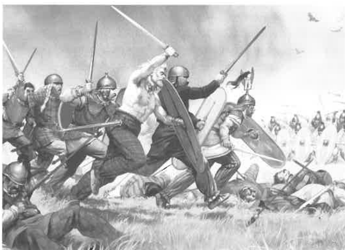
A. McBride: Keltové

Oslabené moravské populace byly rychle začleněny do nového keltského světa, konkrétně do kmenu Volků-Tektoságů. Zbytky platenické kultury se smíchaly s kmenem Kotinů, ale i s germánskými, dáckými a ososkými kolonisty, čímž vznikla púchovská kultura, která se však pokleťstila jenom částečně, i když nepochybně patřila do laténského kulturního okruhu. Púchovský lid zažil výrazný populační i kulturní rozkvet ve 2. až 1. století před n. l., kdy zabral území severovýchodní Moravy, severního Slovenska a jižního Polska, a centrum této oblasti si udržel až do doby římské. Púchované budují velká hradiště a jsou velmi pokrokoví v technologiích – používají např. rotační žernov na obilí, hrnčířský kruh, soustruh a pluh s železnou radlicí. Významným se stává také železářství, které dovedli púchovští řemeslníci až