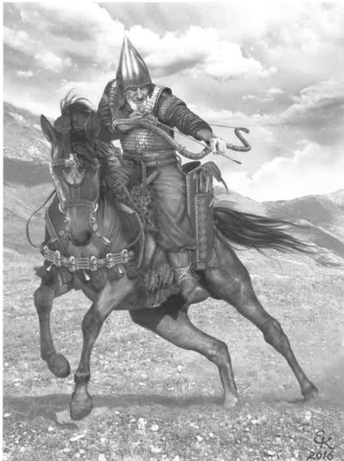
E. Kray: Skytský jezdec

Mladší doba železná začíná příchodem keltských kmenů na naše území. Keltové (obr. 3) vyrážejí ze své pravlasti, jejíž východní okraj ležel v jižních