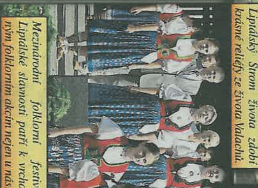
Mezinárodní folklorní festival Lipťácké slavnosti patří k vrcholným folklorním akcím nejen u nás.