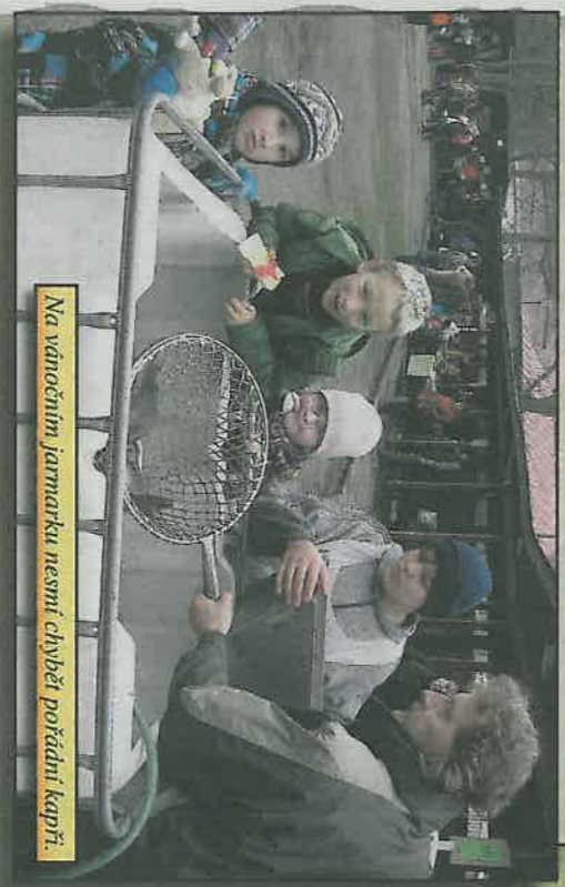
Na vánočním jarmarku nesmí chybět pořádní kapří.