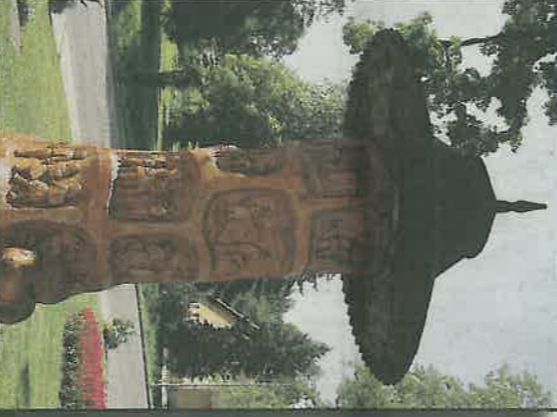
Stranku připravila Ivana Lušvská