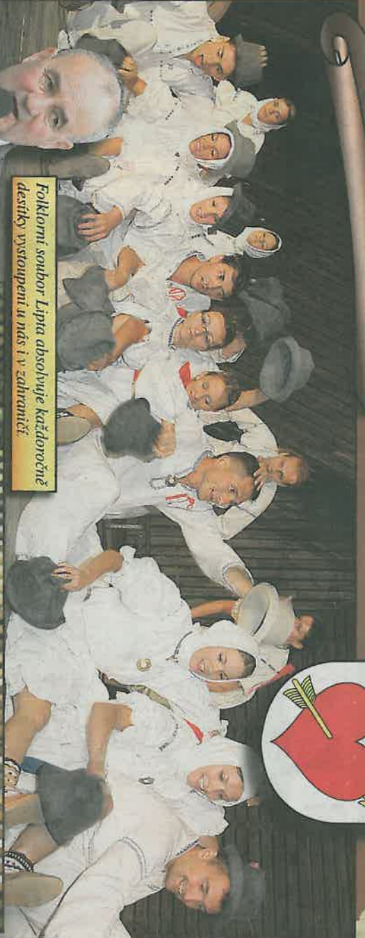
Folklorní soubor Lipťa obsazuje každoročně desítky vystoupení u nás i v zahraničí

Společenský život v obci obnahejují některé tradiční akce. Patří mezi ně bály, plesy, mikulášské pochůzky nebo například koncert. Po smetotkové revoluci se do Lipťálu vrací také adventní koncerty. „Velké zastoupení zde mají i místní pěvecké soubory, například pěvecký sbor Rokytanka i evangelický pěvecký sbor. Žádána větší společenská událost se neobejde bez dechové hudby Lipťanů.