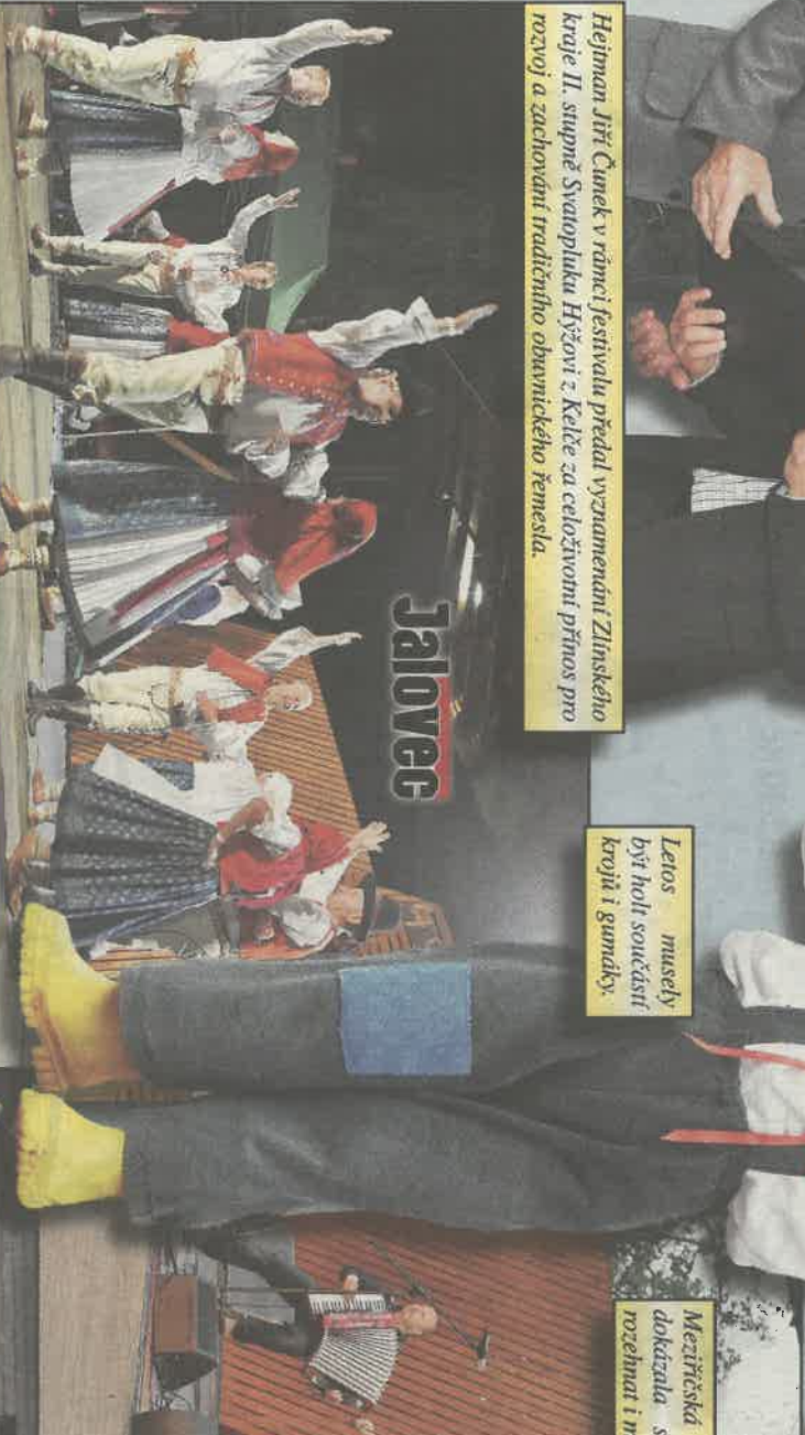
Letos musely být holi součástí krojů i gunnky.