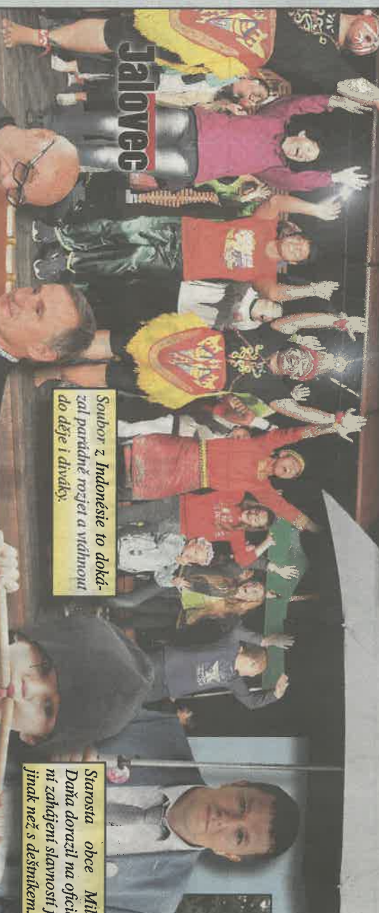
Soubor z Indonésie to dokázal parádně rozjet a vítaností do děje i dívky.