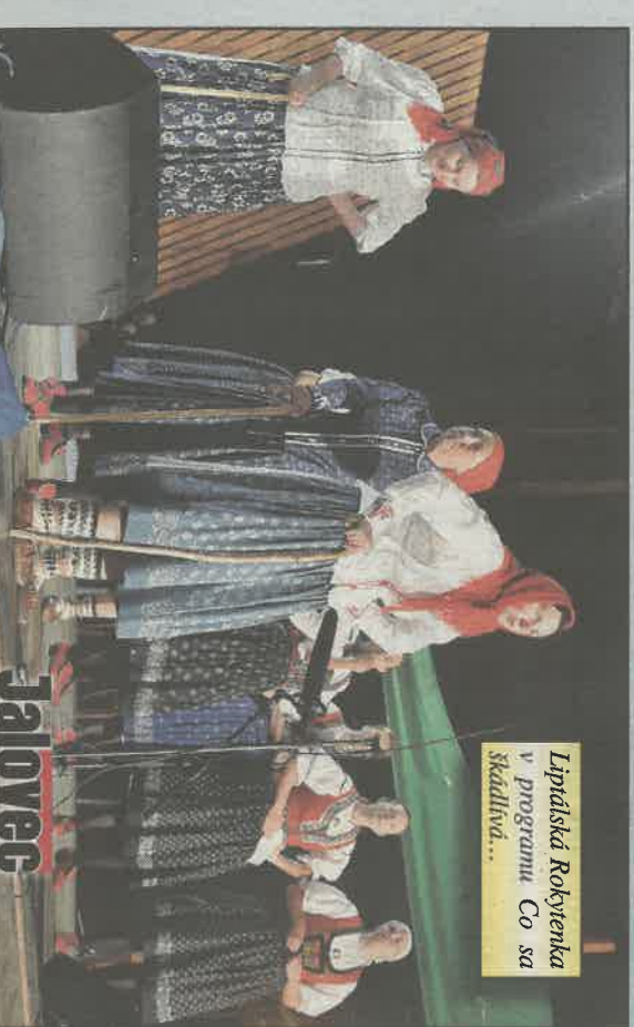
Lipťácká Rokytěnka v programu Co sa škádlivá...