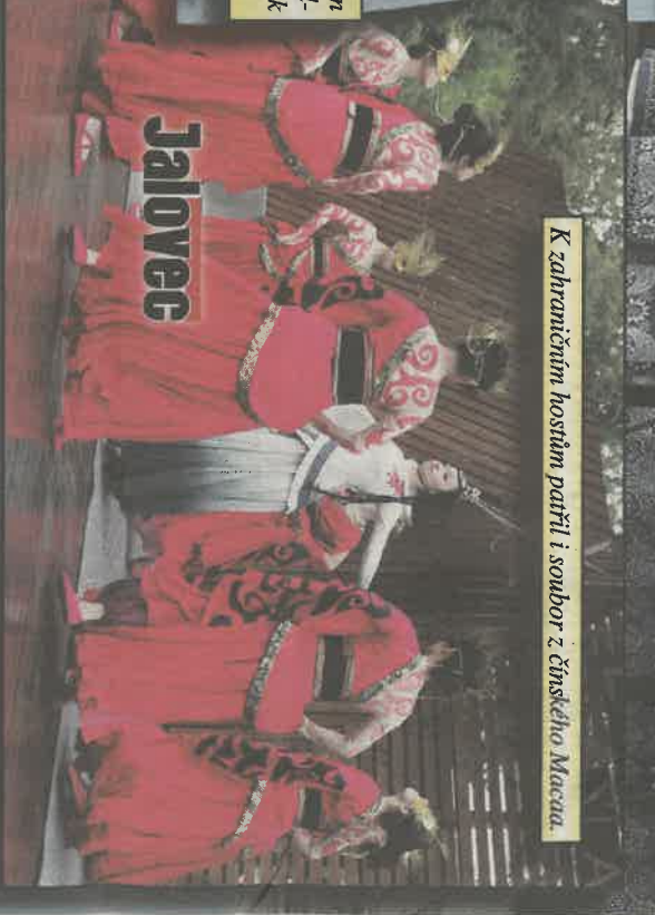
K zahraničním hostům patři i soubor z čínskeho Macaa.