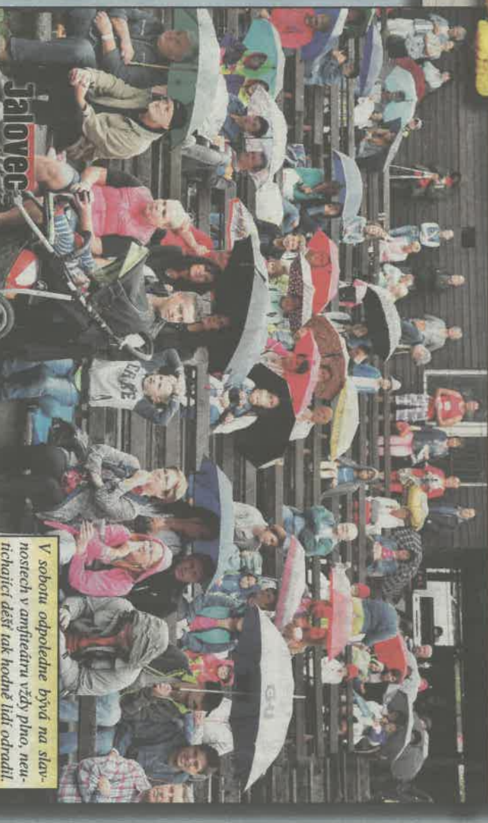
V sobotu odpoledne bývá na slavnostech v amfiteátru vždy plno, nechtějící dešť tak hodně lidí odradil. Večer už to ale bylo mnohem lepší.