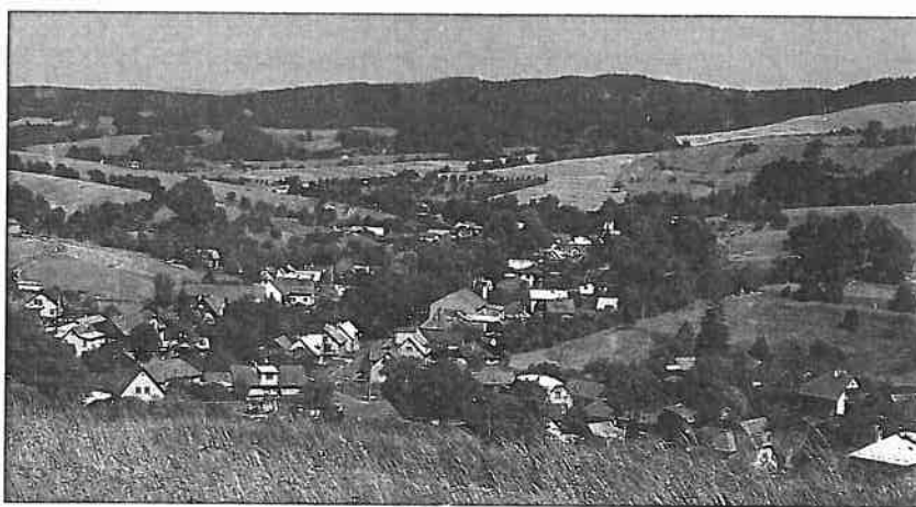
35. Liptál – celkový pohled. Foto Z. Hartinger 1994

Rekatolizační úsilí, které provázelo období po třicetileté válce, v Liptále nepřinášelo očekávané výsledky. To se projevilo zejména v účasti předtolerančním hnutí tamních evangelíků v letech 1777–1781. Po vyhlášení tolerančního patentu v dubnu 1781 se téměř celá obec přihlásila jako