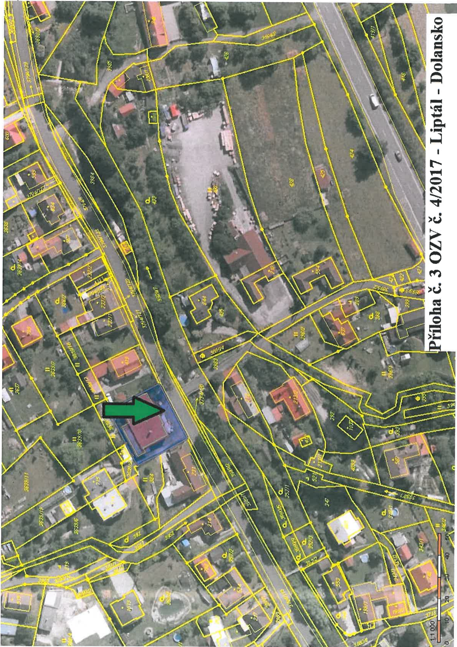
Příloha č. 3 OZV č. 4/2017 - Liptál - Dolansko