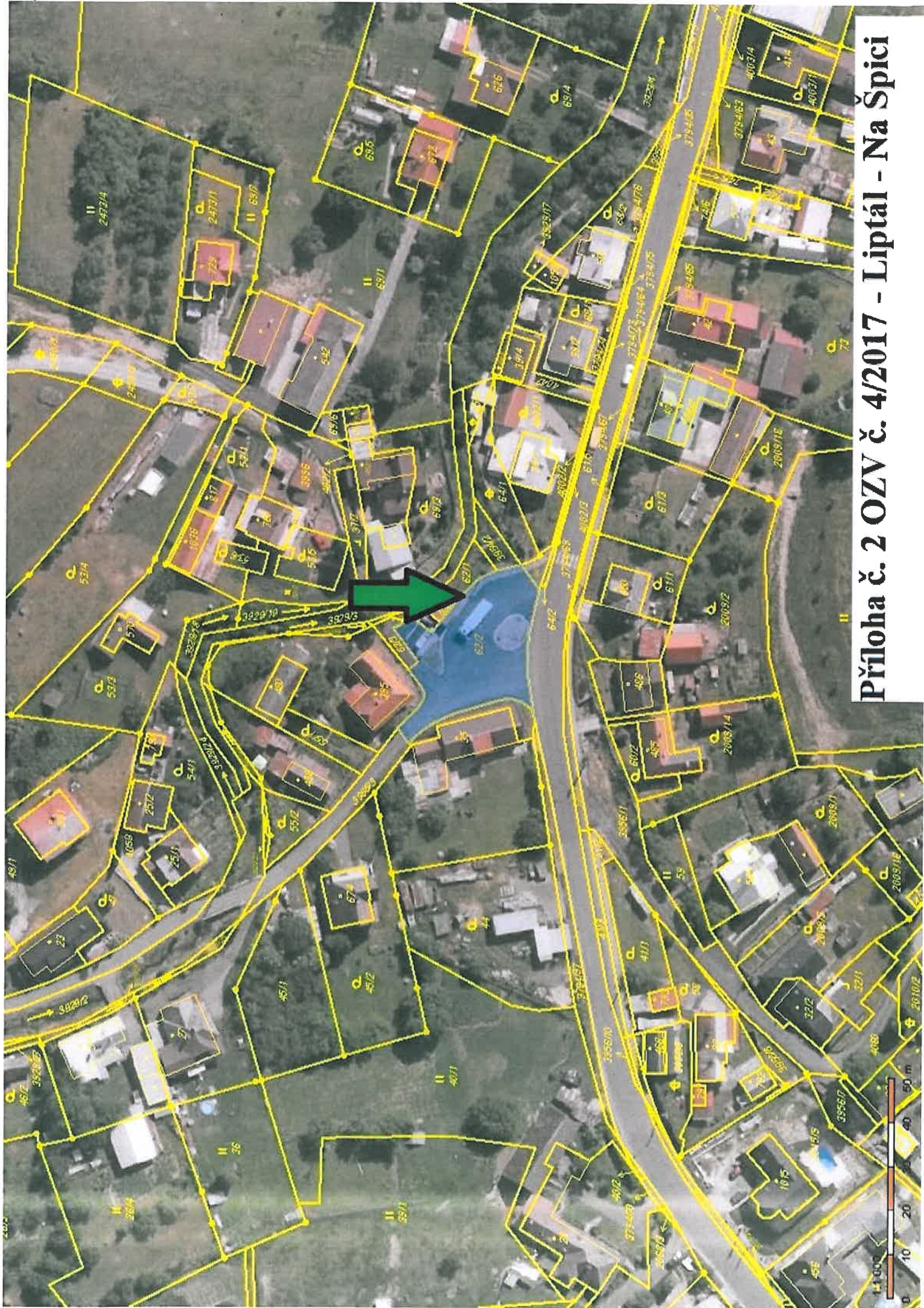
Příloha č. 2 OZV č. 4/2017 - Liptál - Na Špici